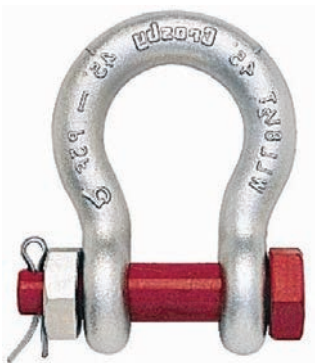
Grillete Tipo Lira con Seguro G-2130