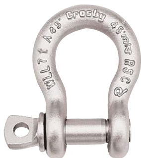
Grillete Tipo lira G-209A