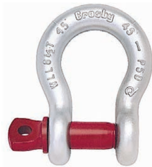
Grillete Tipo Lira G-209