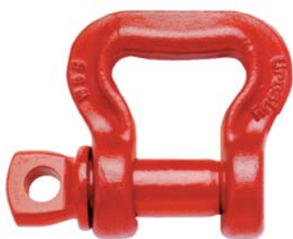
Grillete para Fajas Planas S-281