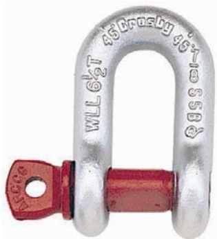
Grillete Tipo D G-210