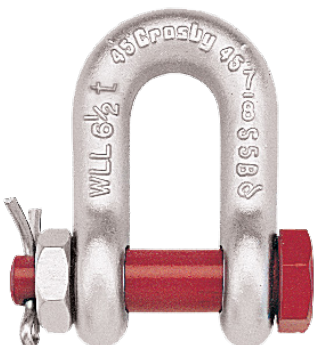
Grillete Tipo D con Seguro G-2150